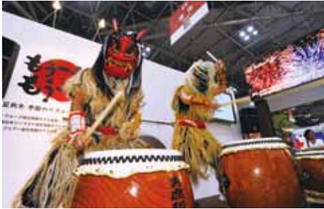
なまはげ太鼓 (秋田県男鹿市役所観光課)