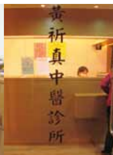
診療室入口と受付