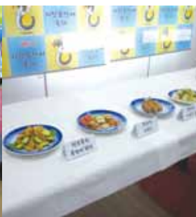
写真2 ブンジャンオ・フュージョン料理試演（祝祭前記者団への披露用）