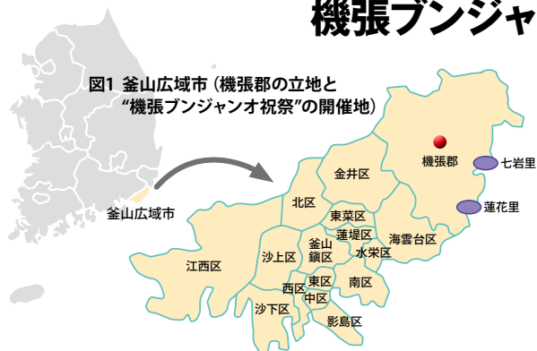
図1 釜山広域市（機張郡の立地と“機張ブンジャンオ祝祭”の開催地）

釜山広域市は韓国第2の都市であり、第1の貿易港口都市である。釜山広域市の行政区域には15の区と1つの郡がある。2011年11月4日から5日まで、釜山広域市の北東部に位置している機張郡の蓮花里で第7回目の“機張ブンジャンオ祝祭”が開催された。“機張ブンジャンオ祝祭”は機張郡の‘七岩里’と‘蓮花里’の2カ所で1年おきに開催されるお祭りで、今年は‘蓮花里’で開催された（図1）。