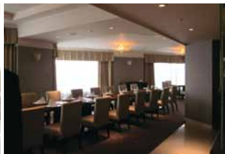
Chef's Table (シェフズ・テーブル:オープンキッチン付きダイニングルーム)