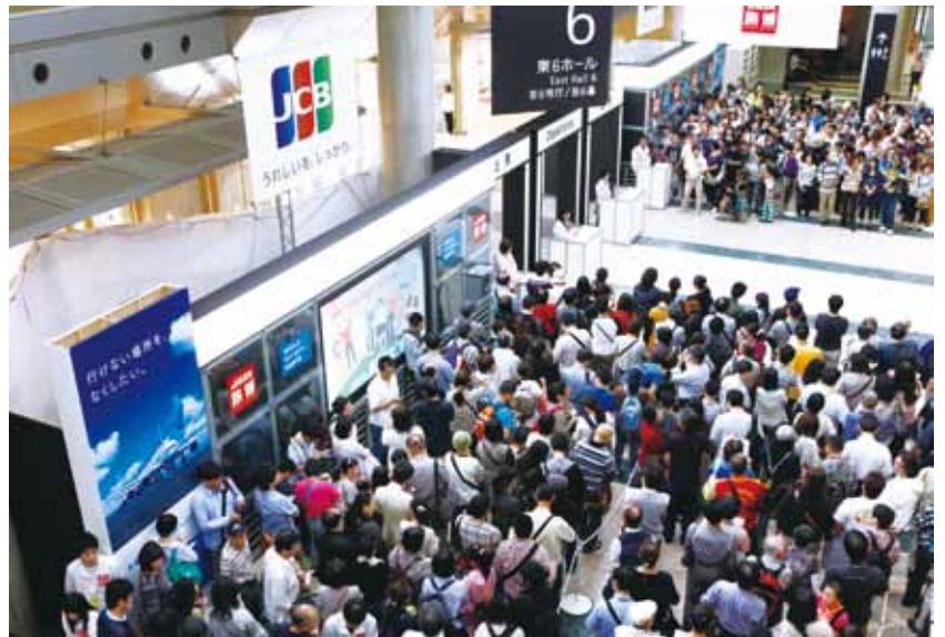
「JATA旅博2011」入場口風景（於：東京ビッグサイト）

2011年春、日本は未曾有の大地震による災害に見舞われ、国内外の旅行需要は一時平年値を大きく下回った。しかし、「JATA旅博2011」は、数々の困難を乗り越え、「旅は世界を元気にする」をテーマに144の国と地域の参加、協力を得ただけでなく、入場者数も前年より約6000人増の大盛況に終わった。「観光立国」を目指す日本が元気を取り戻す、そのきっかけづくりとなった旅行関連イベントが持つ役割と、現在に至るまでの軌跡、そして成功の要因を聞いてみた。