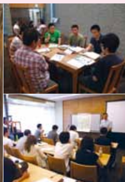
（上）グループワークの様子 （下）授業風景