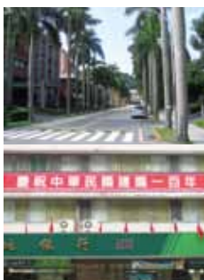
(上) 中央研究院内・数理大道 (下) 祝中華民國建国百周年

私はこれまで9回通院し、右腕に毎回8、9本程度の鍼治療を受け、ひじはだいぶ改善してきました。ただし、離台するまで続けた方が良いといわれているので、しばらく通院することになるはずですが、中国医学の特徴を一言でいうと「スロー」な医療ということでしょう。病気をゆっくりと根本的に治すという感じがあります。今回の滞在中では幸か不幸か、医療観光を経験することができ、あらたな台湾のおもしろさを発見した次第です。