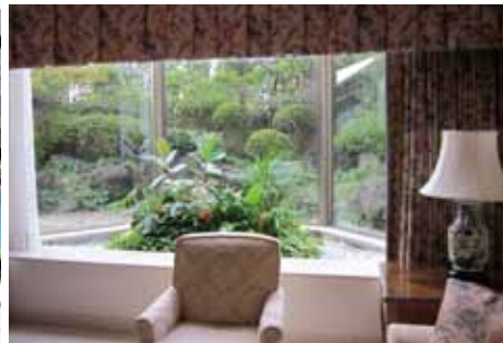
客室 コンサバトリー (64㎡:ジュニアスイート)