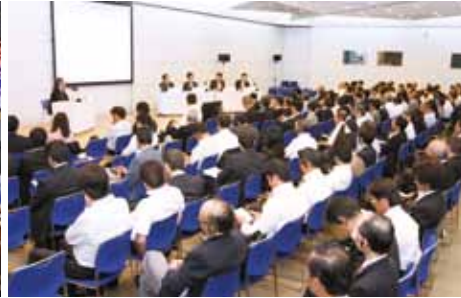
観光フォーラム (シンポジウム2)