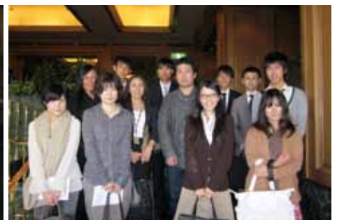
集合写真 (2011年10月17日撮影)

フォーシーズンズホテル椿山荘東京(以下フォーシーズンズ椿山荘)は1992年1月16日にフォーシーズンズホテルのアジア地区進出第一号ホテルとして開業した。