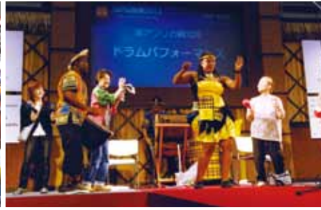
EASTステージ (ドラムパフォーマンス: 南アフリカ観光局)