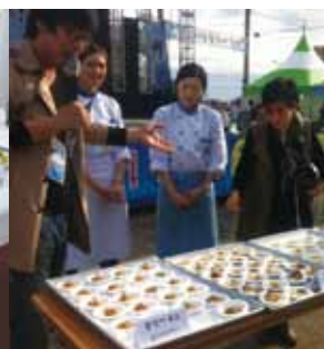
写真3 ブンジャンオ・フュージョン料理試演（祝祭中）