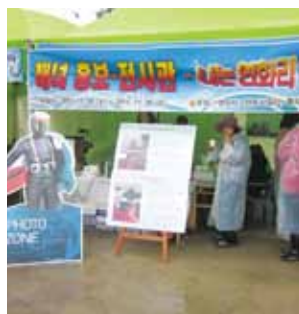
写真1 蓮花里海女広報展示館