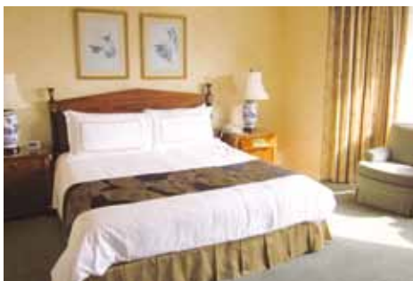
客室 スーペリア (45㎡:シティビュー)