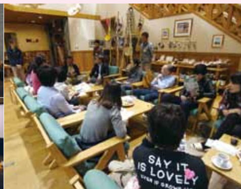
「森の家」（飯山市）での交流会

観光研究所は、戦後すぐの1946年に始まった伝統を持つホスピタリティ・マネジメント講座と旅行業講座を公開講座として長く開講してきており、観光業界に多くの人材を送り出してきた。この二つの講座は、開設当初より本学学生だけではなく、他大学生および社会人に門戸を開いた“公開講座”として運営されてきた点に大きな特色がある。