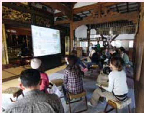
観光地経営専門家育成プログラム お寺の本堂での研修（飯山市）